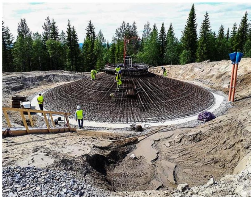
Arbete med anläggning av ett gravitationsfundament. Till 15 av de 84 vindkraftverken i projektet används gravitationsfundament. Till de övriga används olika varianter av bergsförankrade fundament.

Här en länk till facktidskriften Entreprenadaktuell som beskriver bygget av vindkraftverk utifrån entreprenörens synvinkel. Förödelse av marken blir här väldigt tydlig. Läs artikeln här .