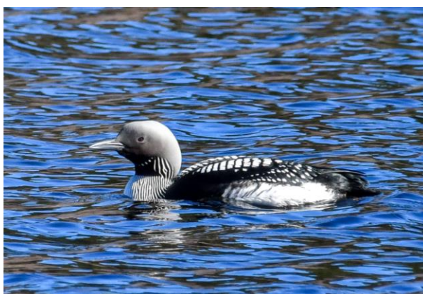
Storlom nyanländ till Sörsjön 6 april.

Om du hittar något intressant, ange platskoordinater eller gör en anteckning på en karta, skriv ner datum, tid och hur många individer du ser och skicka till natur@rvno.se .