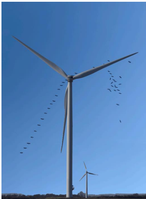
Fotomontage: eda - Hur påverkas tranorna?

I veckan publicerade Naturskyddsföreningen sin nya rapport Vindkraft – en viktig del av framtidens energisystem .