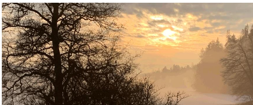
Det blir ljusare nu ...