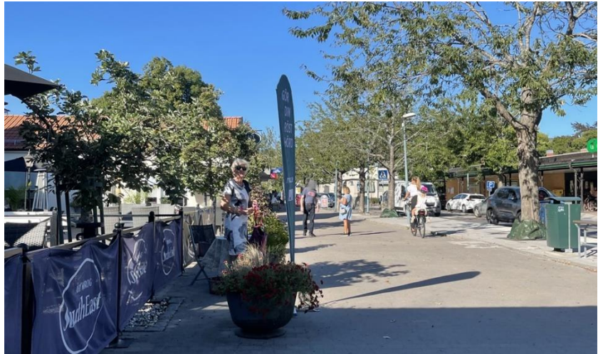
RVNO på plats i Åby centrum på torsdagen

Vi fortsätter på samma ställe idag fredag och på lördag finns RVNO på plats i Regna under marknaden och då i samarbete med föreningen Rättvisa Vindar Vid Regna.