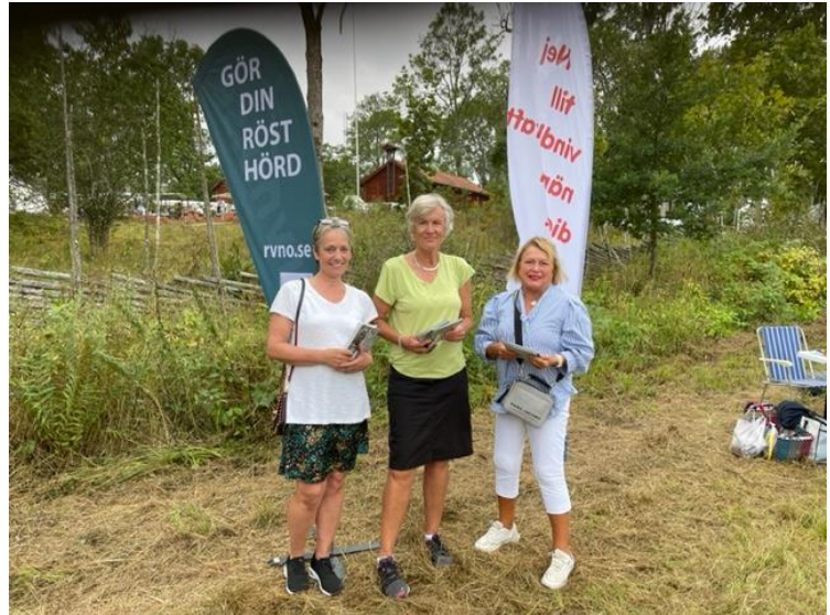
RVNO på plats på Regnamarken i lördags tillsammans med Rättvisa vindar vid Regna, RVVR.

Föreningen Rättvisa vindar norra Östergötland är en ideell förening som har som syfte att tillvarata naturskydds- och miljöskyddsintressen i området. Föreningen ska aktivt arbeta för att förhindra etableringar som negativt påverkar människors livsmiljöer samt landskapets särart i vårt svenska kulturarv.