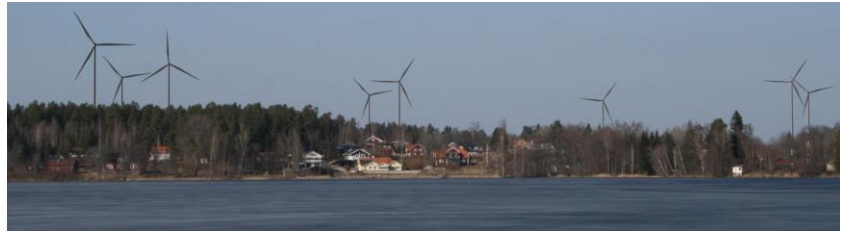
Vy över Simonstorp med hotande vindkraftverk i Klintaberget