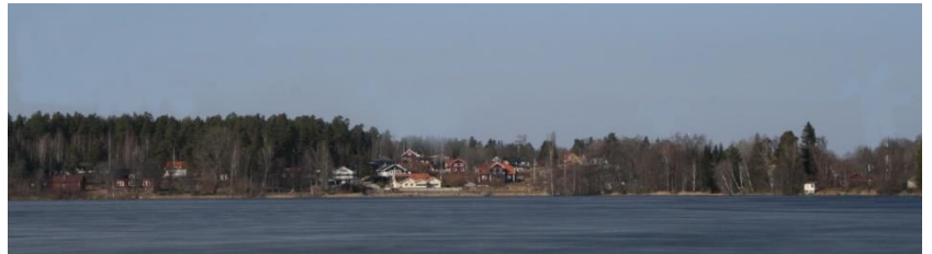
Vy över Simonstorp med avväjrt hot