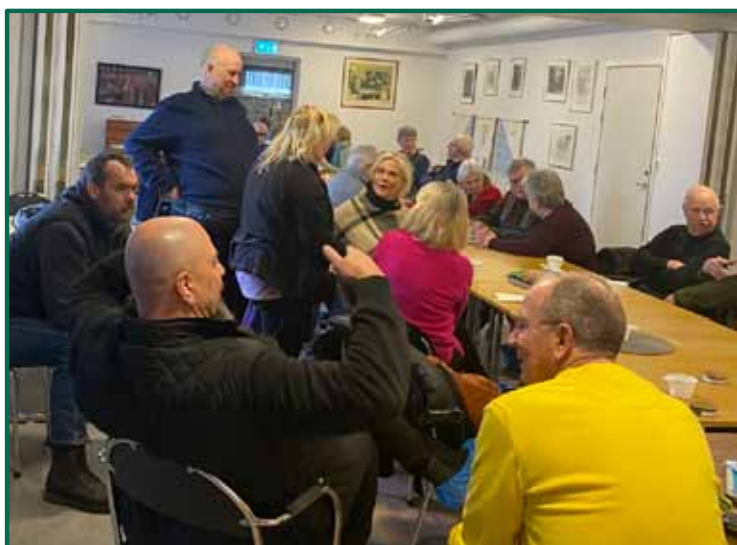
Livliga samtal och trevlig samvaro.

till alla som kom på årsmötet och som stöttar föreningen genom medlemskap och på andra sätt!